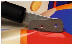
Aufbau als Schubmesser (PUSH) Setup as a push knife (PUSH)