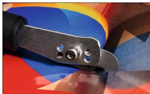
Aufbau als Zugmesser (PULL) Setup as a pull knife (PULL)